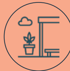
Terraza con chimeneas