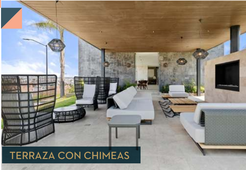
TERRAZA CON CHIMEAS