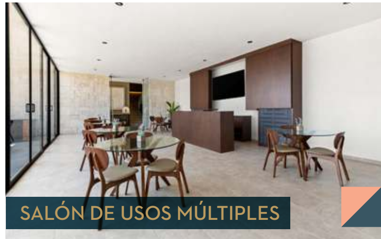
SALÓN DE USOS MÚLTIPLES