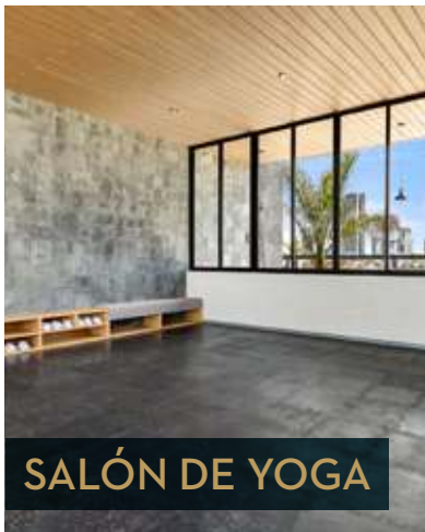
SALÓN DE YOGA