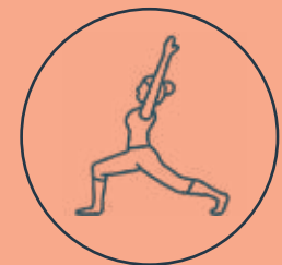
Salón de Yoga