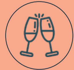
Salón de usos múltiples